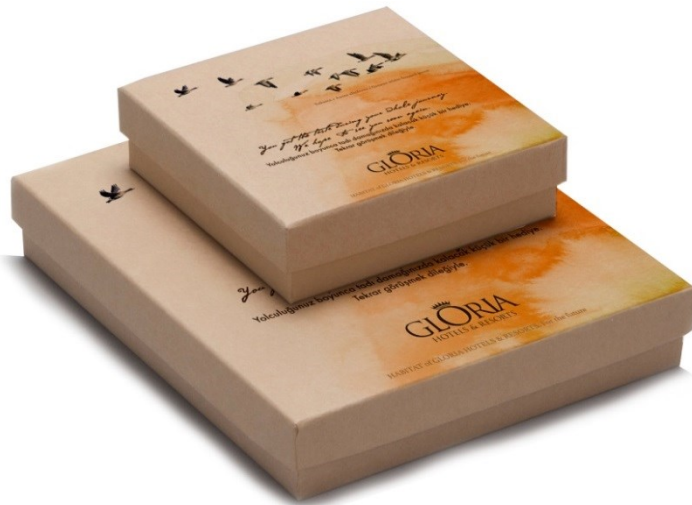
Schokoladenschachtel: Die Blässgans