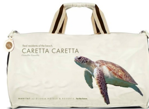
Geschenktasche Sandlilie und Caretta Caretta Die wahren Besitzer des Strandes