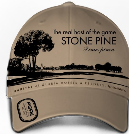
Geschenkkappe: Steinkiefer Der wahre Spielveranstalter