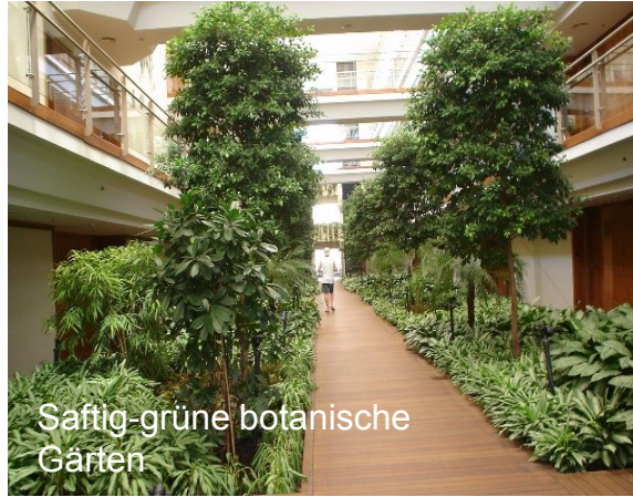
Saftig-grüne botanische Gärten